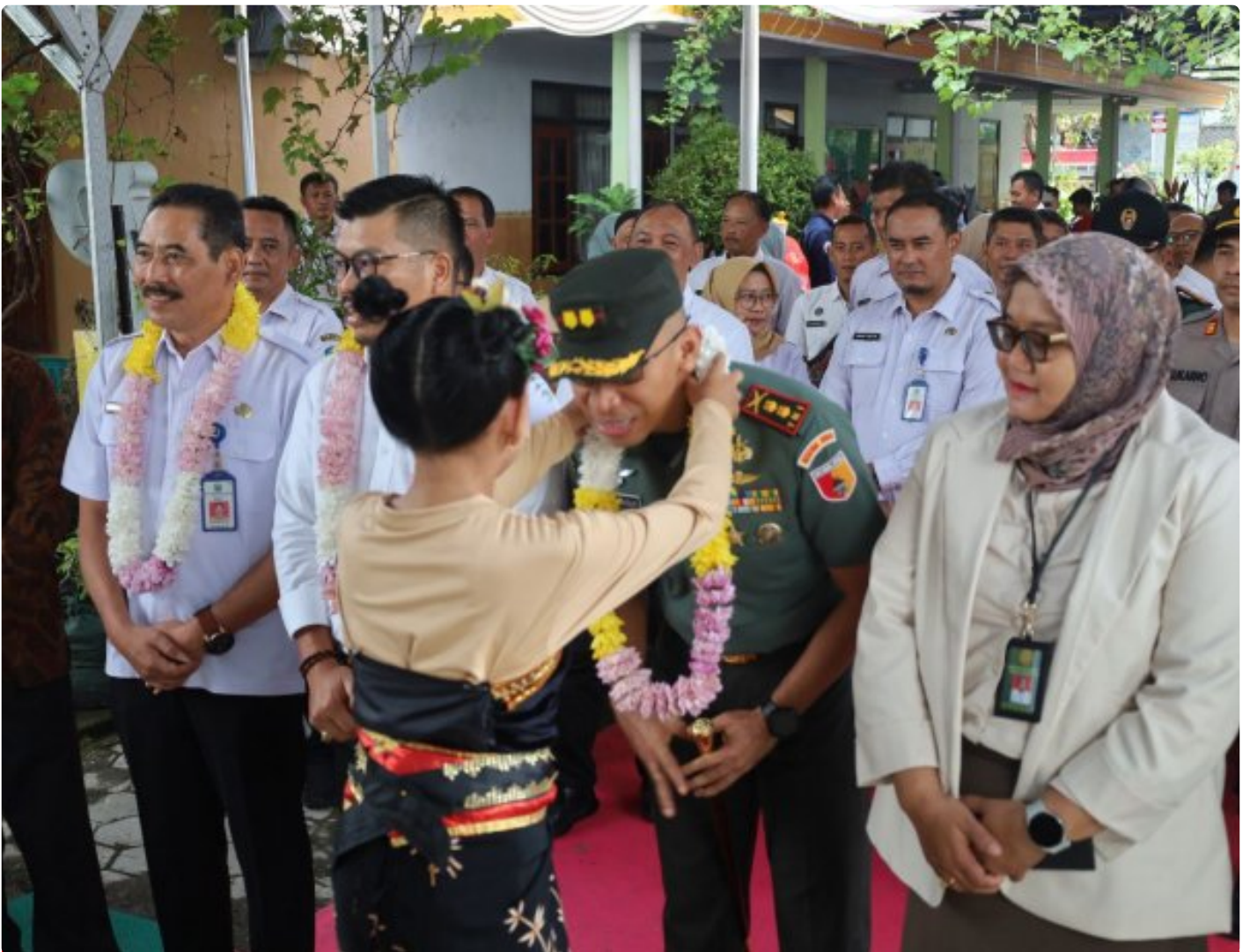
Dukung Program Pemerintah, Dandim 0804/Magetan Hadiri Musrenbang Tingkat Kecamatan